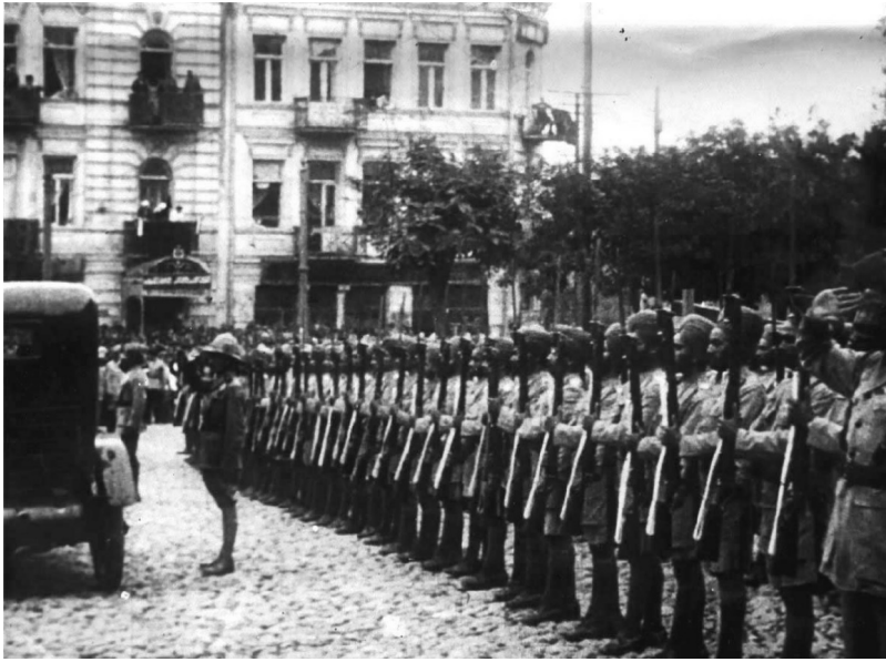
Рисунок 10. Британские вооруженные силы в Тбилиси.