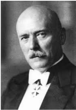
Рисунок 8. Граф Фридрих-Вернер фон дер Шуленбург - Германский посол в Грузии.