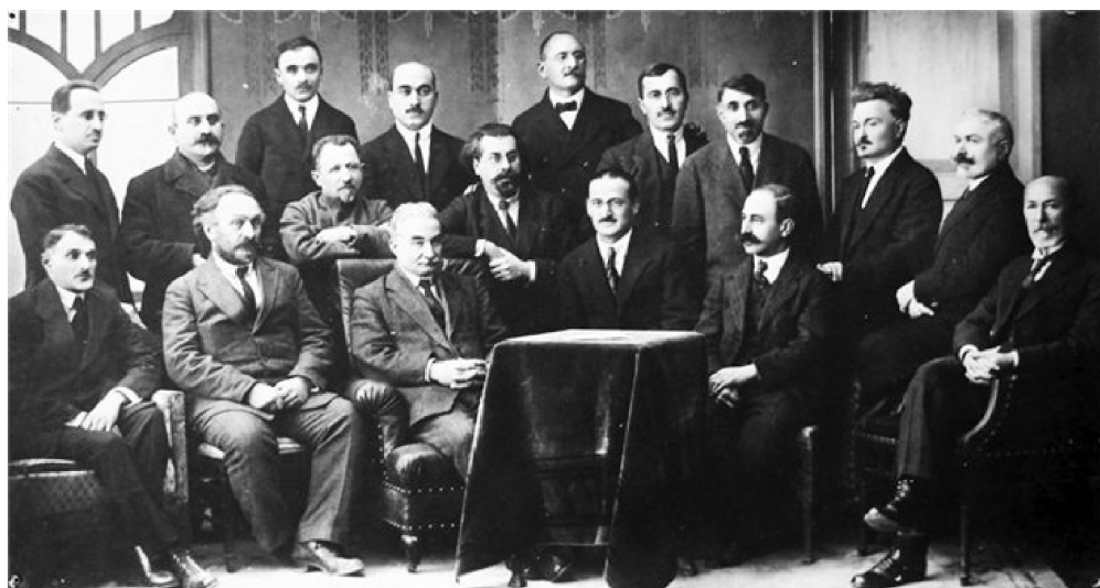
Рисунок 6. Основатели Тбилисского государственного университета.