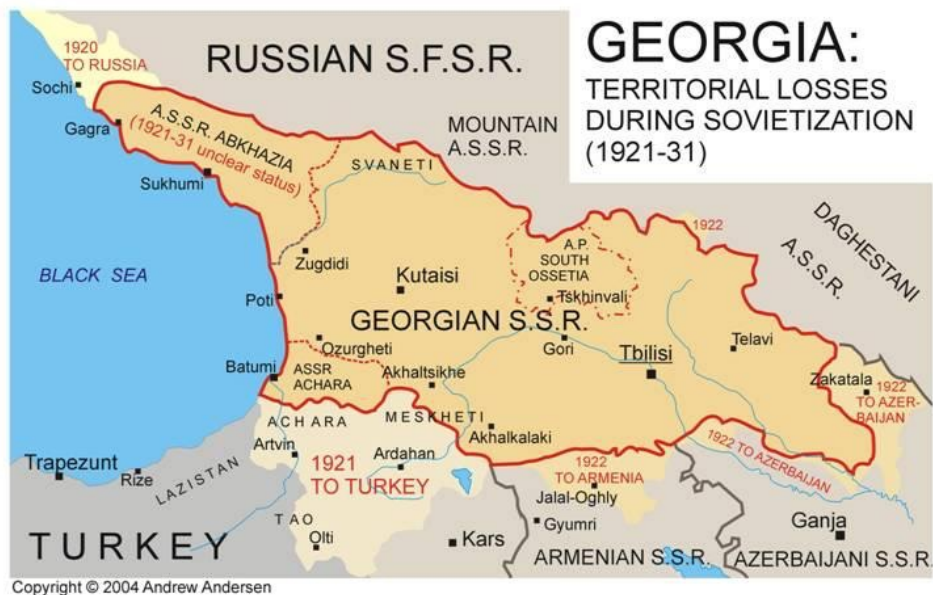
Рисунок 1. Карты Демократической Республики Грузия и Грузинской Советской Социалистической Республики.