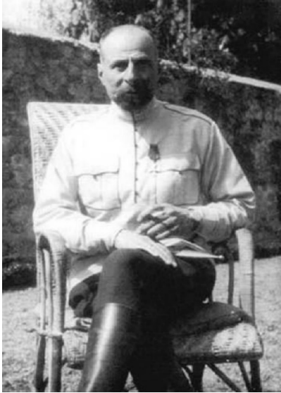
Рисунок 7. Генерал Георгий Квинитадзе.