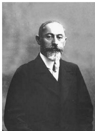
Рисунок 5. Ноэ Жордания