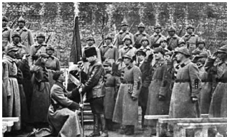
Рисунок 13. Военный парад 11-й Красной Армии России в Тбилиси.

Рисунок 12. Погибшие в боях около села Коджори юнкера.