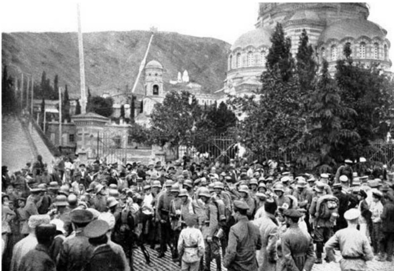
Рисунок 9. Вооруженные силы Германии в Тбилиси.