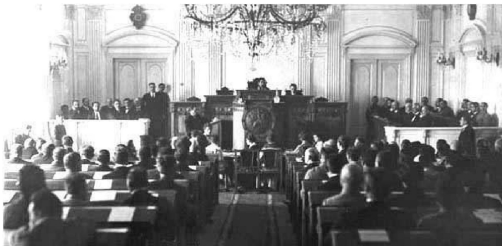
Рисунок 2. Учредительное собрание Демократической Республики Грузия.